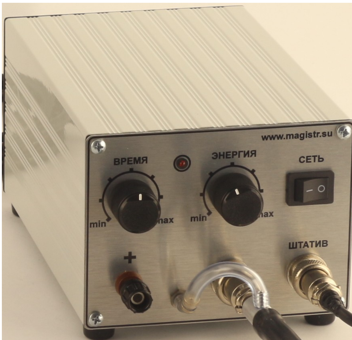
Фото 2. Общий вид блока управления

электрод, зажатый в специальном держателе. Держатель имеет рукоять, за которую оператор берет инструмент и прижимает рабочий конец электрода к месту сварки.