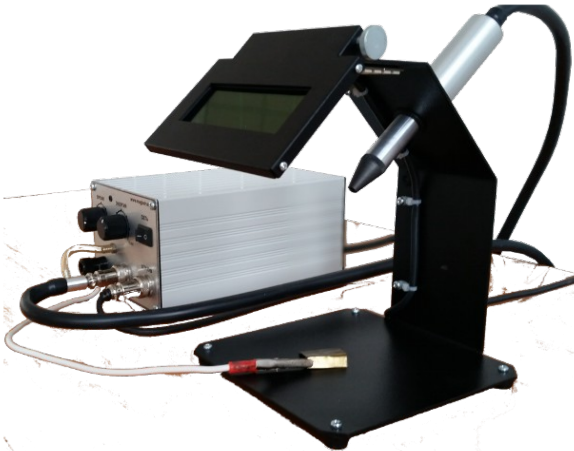
Фото 1. Общий вид устройства

Штатив предназначен для крепления в рабочем положении сварочного инструмента. Он состоит из основания и кронштейна с крепежными узлами, к которому прикреплены сварочный инструмент, осветительный элемент и защитный управляемый светофильтр. Светофильтр затемняется на время формирования сварочного импульса. Крепежные узлы позволяют выбрать наиболее удобное для оператора расположение элементов устройства.